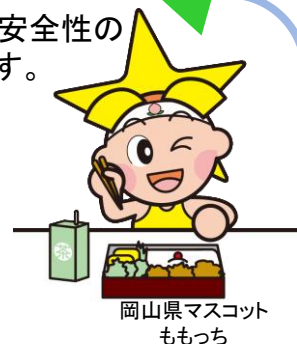
岡山県マスコット ももっち

HACCPについて知ること、食品の安全性の 向上を図るため、講習会を開催します。