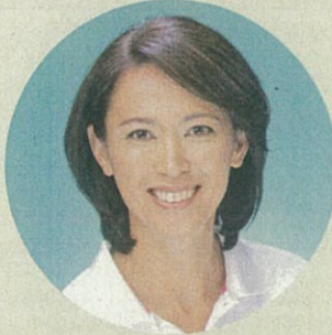
スペシャルアンバサダー 有森裕子さん (岡山市出身)