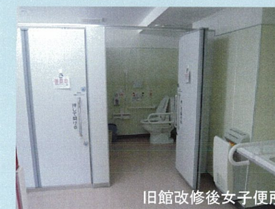
旧館改修後女子便所

新館1階の男女便所は通所リハビリや画像センターを利用する患者さんが使用するため、車いすでも、介助者がつきそっても使い安いうように広いスペースを確保した。