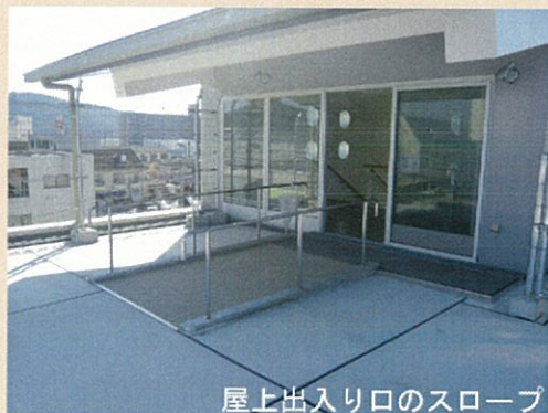
屋上出入り口のスロープ

階段の手摺りは2段として握りやすいものに、蹴上げと踏み面は色を変えて見分けが付きやすいように配慮した。