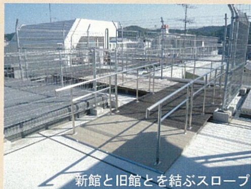
新館と旧館とを結ぶスロープ

車いすで屋上まであがれるようにしてスロープの通路で旧館へも移動できるようにした。ひなたぼっこなどで屋上は患者さんの憩いの場になっている。