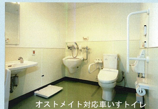
オストメイト対応車いすトイレ

2階談話室ロビーのすぐ横の分かりやすい場所にオストメイト対応の多機能トイレを設置。