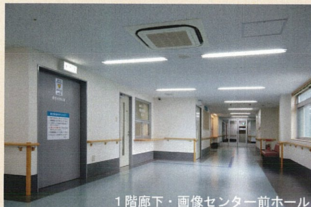
1階廊下・画像センター前ホール