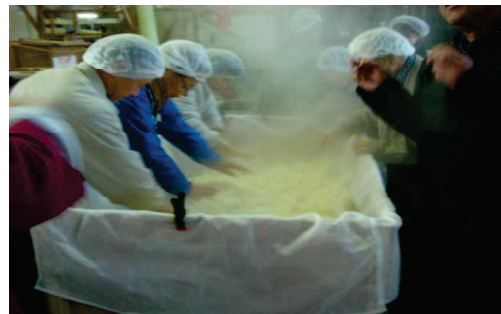
おかやま酒蔵めぐりツアー風景 1 / 19 (嘉美心酒造)