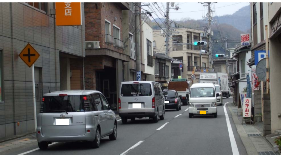
混雑状況 国道250号(日生地区)

県道寒河本庄岡山線は、備前市日生町寒河から岡山市東区君津に至る路線であり、備前市蕃山から岡山市東区君津の間は岡山ブルーラインとして国道2号や国道250号とともに東西交通の幹線的な役割を果たしています。本事業は備前市日生町寒河から同市蕃山間を整備するもので、並行する国道250号のバイパス的な役割を担い、交通混雑が生じている国道250号(備前市日生地区)の混雑緩和や観光振興のため、早急な整備が課題となっていました。