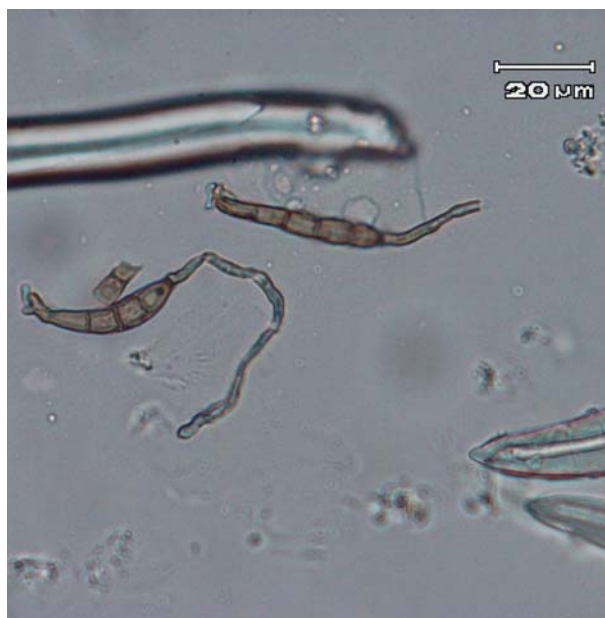
図2 モモ果実赤点病菌（分生子）