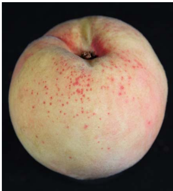
図1 モモ果実赤点病の果実