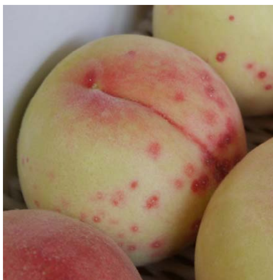
図3 ウメシロカイガラムシによる類似症状 （赤点中心部に吸汁痕や白い虫体が見える）