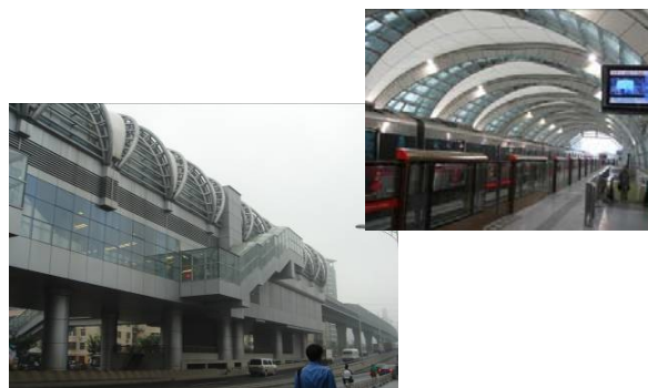
(北京「地下鉄五号線」の内と外)

北京以外の都市でも、山東省青島市では海上競技が、香港では馬術競技が、遼寧省の省都・瀋陽ではサッカー予選が行われることとなっています。