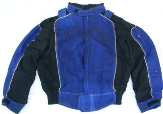
青と黒色ジャンパー(Lサイズ)