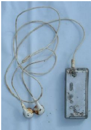
銀色携帯用音楽プレイヤー