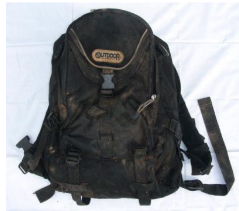
黒色ビニール製リュックサック