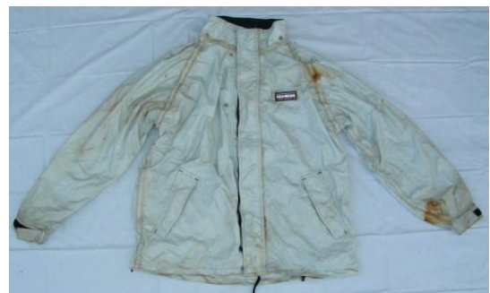
白色レインコート 上下(LLサイズ)

お問い合わせ先:岡山県警察本部鑑識課指紋資料係 代表電話:086-234-0110 内線701-325～327