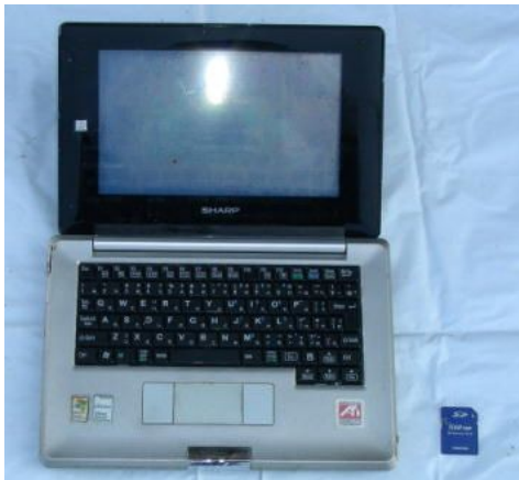
黒色ノートパソコン