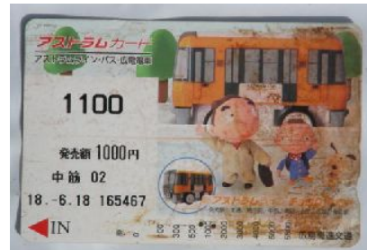
磁気券式乗車カード