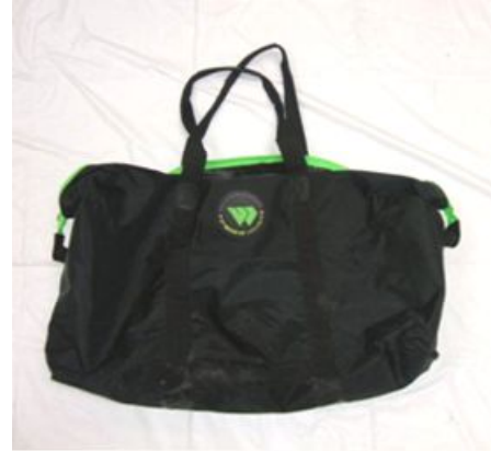
黒色スポーツバッグ