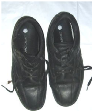
黒色ウォーキングシューズ(26.5cm)