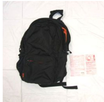
黒色リュックサック