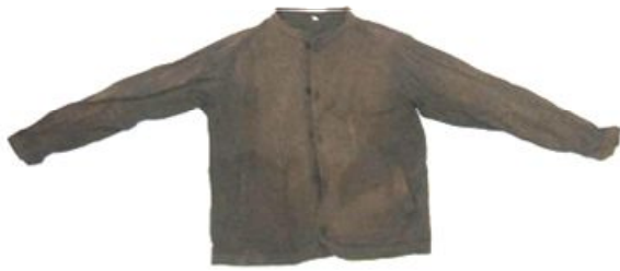
こげ茶色ジャケット