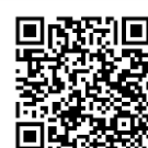
おかやまオンデマンド研修一覧