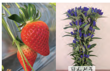
いちご・花の品種育成