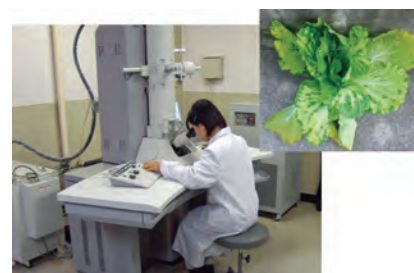
ウイルス病の診断と対策