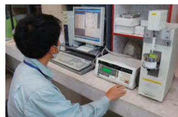
農産物のブランド強化技術の開発