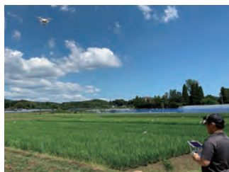
ドローンを利用した水稻生育診断

農林水産総合センターには、農作物の病虫害の発生状況を調査し、情報提供などを行う病虫害防除所を併置しています。