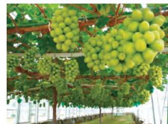
ぶどうの高品質栽培技術の開発