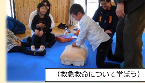
(救急救命について学ぼう)