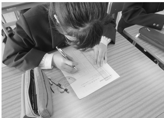
(図3)「レタリング」制作の様子。定規の他に分度器やコンパス、三角定規などを使う生徒もいる。

補助線を使う方法、三角定規や分度器、コンパスを使う描き方もある。生徒は、最初、提示作品の上手さに意識がいくが、描いた方法に注目させることで、どう描くかを考え始め、各自で制作に向かった。