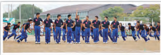
感動と感涙を呼ぶ体育モデルの『集団行動』。