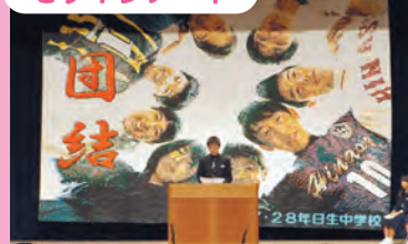
モザイクアート……1.5cm四方の色紙を貼り合わせ、4.5m×5.8mの作品を生徒全員で完成させます。