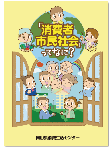
岡山県消費生活センター

消費者市民社会とは、消費者一人ひとりが、お互いに尊重して、助け合い、自分だけでなく周りの人のことや状況を配慮して、より良い社会を作ることに主体的に参画する社会のことです。事業者、生産者も含めてあらゆる立場の一人ひとりが「消費者」であり、子どもから大人までそれぞれが自分でできることを考えて行動することが大切です。