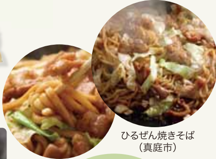
津山ホルモンうどん (津山市)