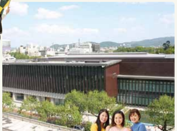
岡山県立図書館(岡山市)