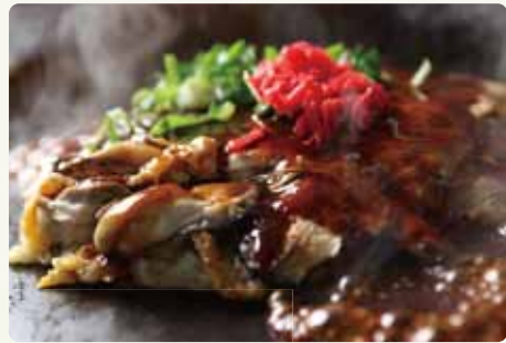
日生カキオコ(備前市)

海の幸・山の幸に加え、フルーツも豊富。また地元から生まれたさまざまなグルメもあり、楽しい食生活が過ごせます。