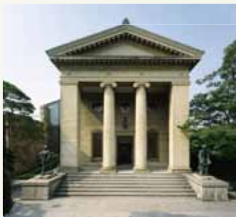
大原美術館(倉敷市)