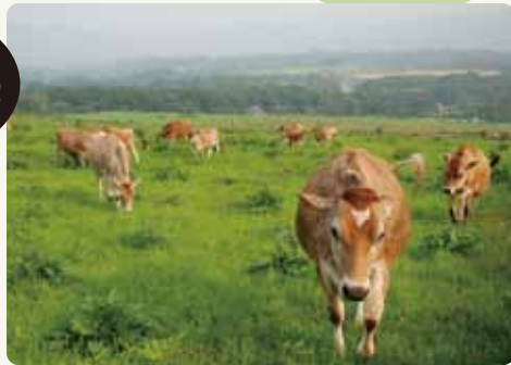
ジャージー牛(真庭市)