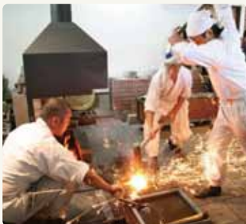
備前おさふね刀剣の里 備前長船刀剣博物館(瀬戸内市)

アートに触れることのできる街、岡山県は美術館や博物館、文化施設などが多くみなさんの興味や関心に応えることができます。