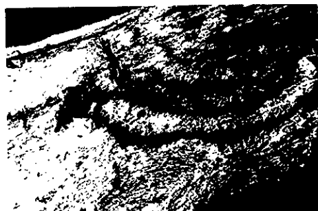
図版2. T. longibrachiatum によるシイタケ菌の侵害状態 1975,