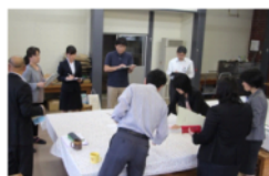
授業後の校内研修