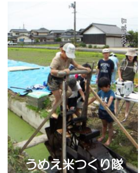
うめえみづくり隊