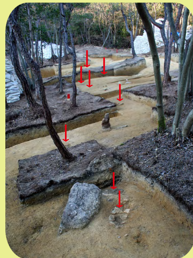
▲ 列状にならぶ鍛冶炉