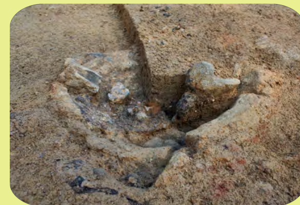
▲ 羽口と鉄滓が残る鍛冶炉