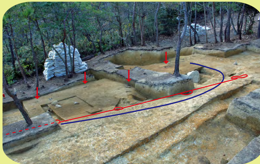
▲ 長大な建物と段状遺構の中で見つかった鍛冶炉