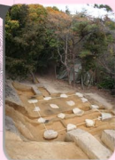
▲ 小さな礎石建物 (高床倉庫)