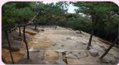
▼ 大きな礎石建物（鬼ノ城の管理棟か）