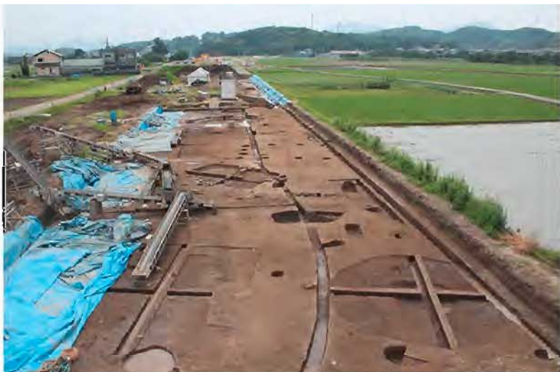
発掘調査の様子 (東から) (平成27年7月3日撮影)