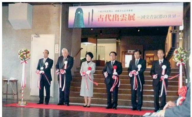
「古代出雲展—国宝青銅器の世界—」テープカット