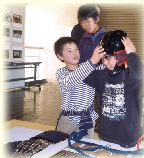
＜企画展より＞「岡山の戦国時代」 関連行事 『本物のよろいや鉄砲にふれてみよう!』