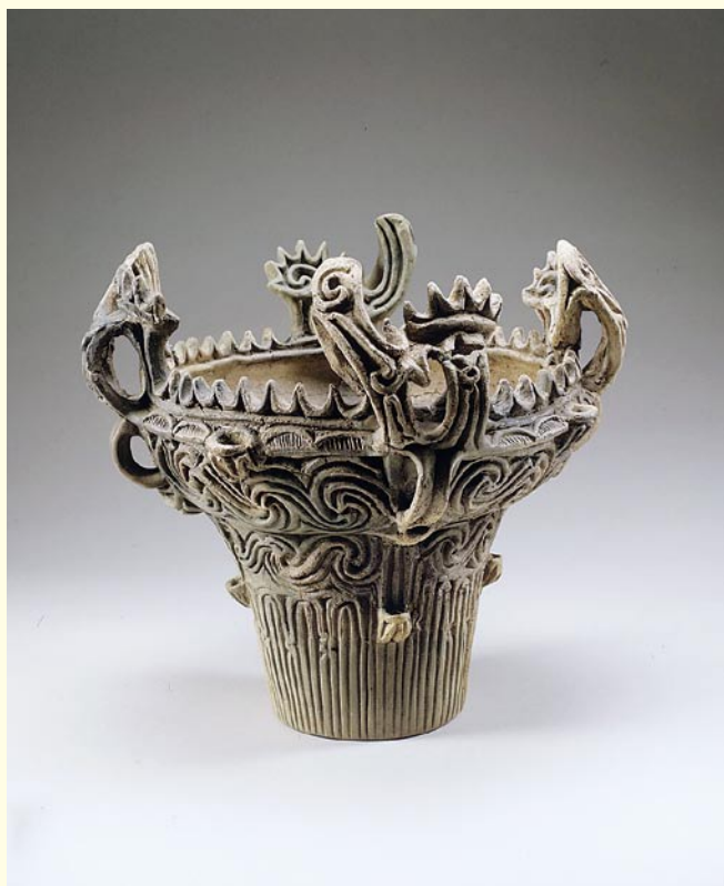
＜特別展より＞ [重要文化財] 火焰型土器／新潟県堂平遺跡出土 (文化庁蔵、津南町教育委員会保管)