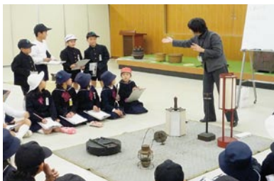
体験「昔の暮らし・道具」の授業

「館内授業」は本館で実物資料に触れたり展示を見学したりするもので、「出前授業」は学芸員が実物資料を持って、学校に出向いて行う授業です。いずれも学校教育との連携事業として、実施しています。今年度も多くの学校より依頼がありました。特に、小学校3年生の学習単元である「昔の暮らし」の授業は好評を得ています。