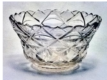
江戸切子深鉢 江戸時代 岡山県立博物館蔵