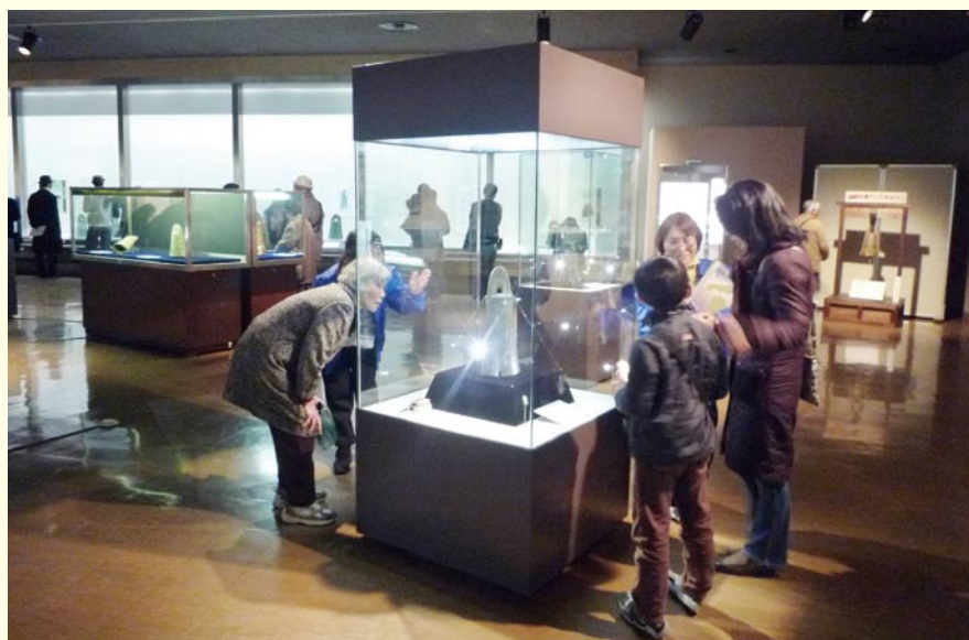
＜交流展より＞「古代出雲展—国宝青銅器の世界—」展示風景