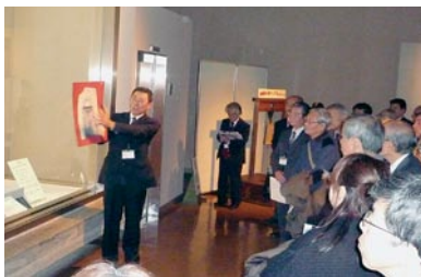
「古代出雲展 一国宝青銅器の世界」 展示解説の様子

毎月第2・4土曜日の午後2時から、学芸員が展示解説を行っています。展示会の内容を詳しく、展示資料を分かりやすく説明しています。今年度も毎回多くのお客様にお越しいただいています。解説の後には多くの質問が寄せられることもあり、熱心に展示を御覧いただいています。