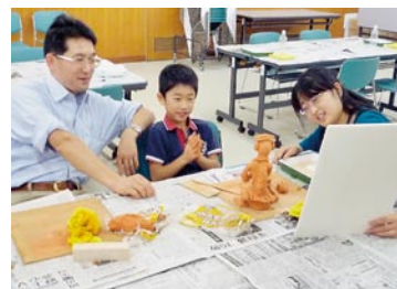
ぼくの、わたしのオブジェづくり～古代の土器やはにわにチャレンジ!

いただき、親子66名が紙ねんどのオブジェを作りました。これらの作品は、2階ロビーに展示しました。「本物の縄文土器を見て、さわってみよぼくの、わたしのオブジェづくり～古代の土器やはにわにチャレンジ!」では、202名の方が火焰型土器や吉備の弥生土器の破片を間近で見たり、手にとったりしました。また、初めての試みとして、会期中1週間連続のボランティアガイドも行い、156名の入館者から好評を得ました。（主幹 正木茂樹）