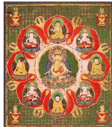
両界曼荼羅（胎藏界・部分） 瀬戸内市 宝光寺蔵

展示では、日本に本格的に密教をもたらした最澄・空海の紹介にはじまり、記憶力を高めるとされる虚空蔵求聞持法などの各種修法や仏像・絵画に表現された密教で信仰される不動明王などの諸尊像を紹介しました。また、神仏習合の歴史の中で高野四社