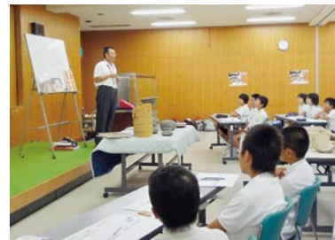
博物館での館内授業 「古墳って何？」