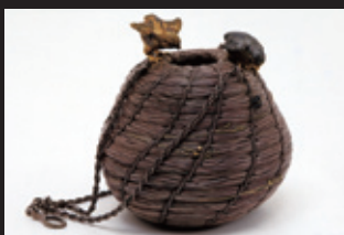
籬籠釣花瓶 岡山県立博物館蔵