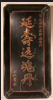
延寿返魂丹看板 元禄17(1704)年 岡山県立博物館蔵

備前国和気郡益原村の万代家11代常閑は江戸時代、家伝薬「延寿返魂丹(えんじゅはんごんたん)」を越中富山へ伝えたとき富山の売薬の歴史へ大きな影響を与えた人物として知られています。本展では、万代家の様々な資料や、富山県の売薬関係資料を紹介し、万代常閑の業績を考えます。