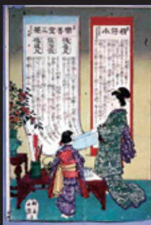
引札 精鑄水(岸田吟香が発売した目録)明治時代 岡山県立博物館蔵

岡山県に生まれ、育まれた多くの人材が様々な分野で活躍し、わが国の歴史に名を残してきました。本展では、わが国の近代に学問、教育、政治、文化などの分野で活躍した人々の生涯や業績を、関係資料の展示を通じて紹介します。