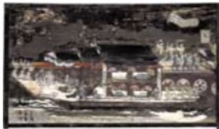
瀬戸内市指定重要文化財 朝鮮通信使船図(瀬戸内市 若宮八幡宮蔵)

「鎖国の時代」と呼ばれている江戸時代にも、友好使節である朝鮮通信使は、日本を12回訪れました。通信使は瀬戸内海を船で進み、岡山では牛窓に立ち寄りしました。この展覧会では、絵画資料やさまざまな記録から、朝鮮通信使について紹介します。