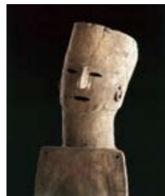
人物埴輪〈橋持人〉(岡山県教育委員会蔵)

かつて吉備国とよばれた岡山県は、全国有数の遺跡の宝庫です。この展覧会では、県内の発掘調査で近年とくに注目された遺跡やその出土品から、古代吉備の考古学研究の最新成果を紹介します。