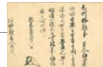
○足利尊氏御判御教書