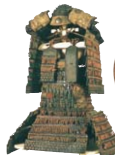
●赤韋威鎧 兜・大袖付