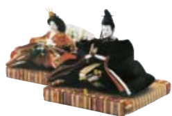
高松松平家伝来雑道具(高松松平家歴史資料)

岡山・香川の文化交流を図る企画の第2弾で、維新をむかえて華族となった松平家の明治以降の収集品を中心に展示します。女性たちが愛した雑道具や当主が集めた近代絵画など、旧大名家の華やかな文化の一端を紹介します。