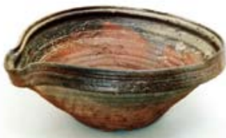
備前焼播鉢(岡山県立博物館蔵)

千年の歴史に彩られた備前焼の世界を御堪能ください。炎と土、そして人が織りなす窯変の景色や美の技術の推移も紹介し、郷土の生んだ伝統的な焼き物についての歴史を掘りさげるとともに人間国宝の技と美を御覧いただけます。