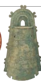
○高塚遺跡 突線流水文銅鐸