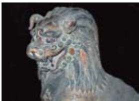
重要文化財 木造獅子狛犬一対のうち獅子(岡山市 吉備津神社蔵)

古代には吉備国の、中世以降は備中国の一宮であった吉備津神社には、鳴釜神事や矢立神事といった古式ゆかしい行事や、重要文化財に指定されている狛犬など、多くの有形・無形の文化財が残されています。この展覧会では、吉備津神社の建築・美術・工芸・古文書や、吉備津神社をめぐる人物など、その歴史と文化財を総合的に紹介します。