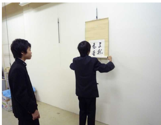
掛け軸の取り扱い方を学んでいます。