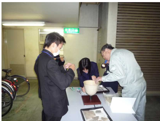
縄文土器の文様を復元しました。