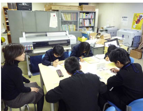
博物館の広報活動について学んでいます。