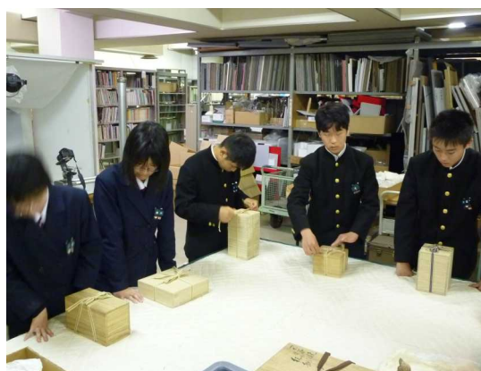
焼き物を箱におさめる練習です。