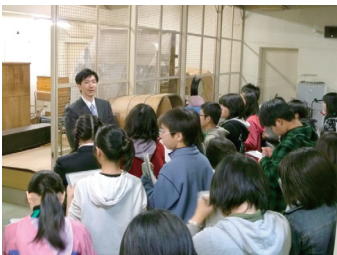
バックヤード見学

本館で実物資料に触れ、展示の見学を行う「館内授業」、学芸員が学校に実物資料を持参してテーマに基づいた授業を行う「出前授業」は、いずれも大変好評で、館内授業は52校、出前授業は17校にご参加いただきました。展覧会に合わせての見学や博物館のバックヤード見学も好評でした。