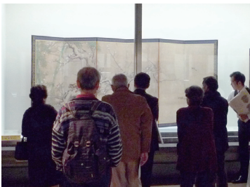
「晴れの国の名宝—岡山の国宝・重要文化財—」展示解説

毎月第2・4土曜日の午後2時から、学芸員が展示の内容を詳しく分かりやすく説明しています。今年度も毎回多くの来館者にご参加いただきました。