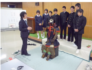
美術工芸品の取り扱い実習

今年度もチャレンジワークとして岡山市内の中学校2年生（7校25名）が博物館業務を体験しました。想像以上に大変な学芸員の仕事やその厳しさを感じたようです。また、2月には学芸員を