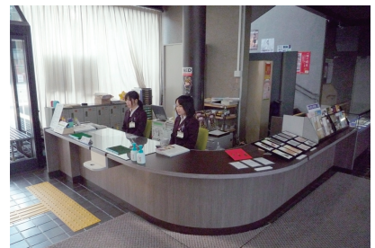
新しくなった受付カウンター

本館では平成20年度から3年間で施設のUD化を進めており、平成20年度には来館者用エレベーターの設置と玄関の自動ドア化を、平成21年度には来館者用トイレの改修を実施しました。今年度は、車いす使用者に配慮した受付カウンターを新しく設置するとともに、階段の手すりを握りやすい2段手すりに改修しました。