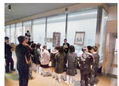
小学生の展示見学