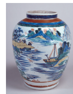
色絵山水文壺 伊万里・柿右衛門様式 文化庁蔵