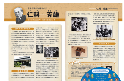
『先人に学ぼうガイド』と『先人に学ぼうガイド指導資料集』（CD）