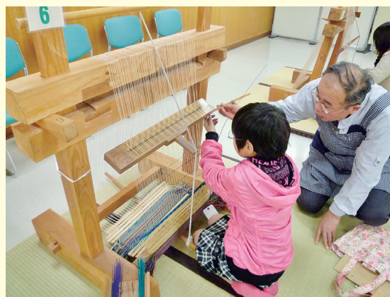
<企画展より>ミニ機で花ござ織り体験をしよう！