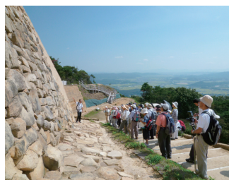
〔屋外博物館〕学芸員とめぐる鬼ノ城バスツアー

また、初めての〔屋外博物館〕学芸員とめぐる鬼ノ城バスツアーには50名が参加し、秋空の中鬼ノ城を散策し、発掘現場も見学しました。