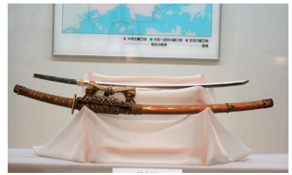
太刀 銘 守家（展示風景）

「太刀 銘 助長」は、表の銘文「備前国長船住助長作」から鎌倉時代の備前長船派刀工である助長の作品と考えられます。助長の在銘品は数少なく、本作は歴史資料として貴重であるとともにその出来映えから助長の最高傑作と考えられます。また、裏の銘文には「正和元年二月日」とあり、1312年に制作されたと思われます。