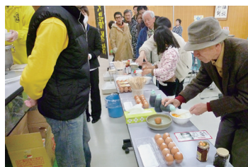
吟香さんのたまごかけごはんを味わおう！