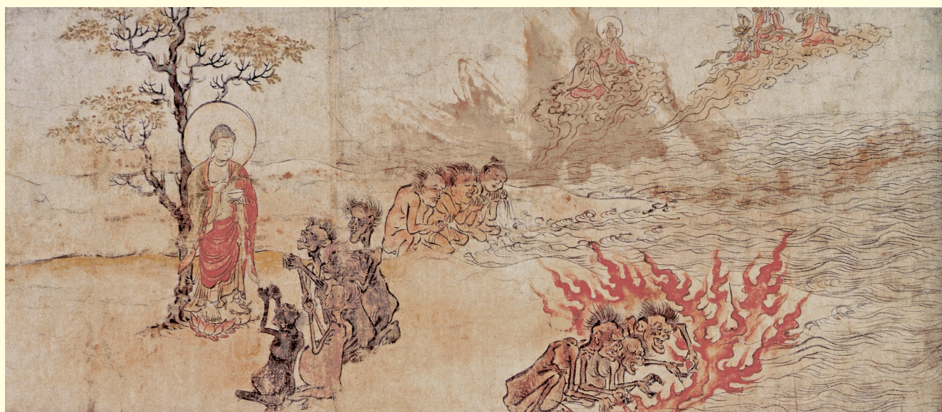
<特別展より>〔国宝〕「餓鬼草紙」第五段（京都国立博物館蔵）