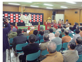
吉備楽～神々に捧げる調べと舞～

島根県立古代出雲歴史博物館名誉館長上田正昭氏による記念講演会「古代出雲と神々の世界」には、約290人が集まり、貴重なお話を拝聴しました。