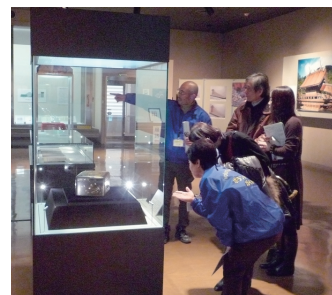
ボランティアガイド

黒住教奏楽寮による「吉備楽～神々に捧げる調べと舞～」には約220人が集まり、吉備楽の演奏と華やかな舞を堪能しました。