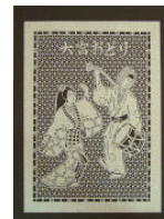
シリゲ 岡山県立博物館蔵