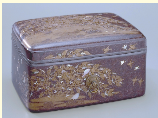
<交流展より> 〔国宝〕秋野鹿蒔絵手箱（出雲大社蔵）