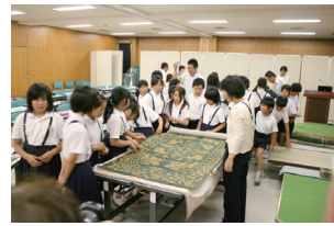
い草コースの館内授業