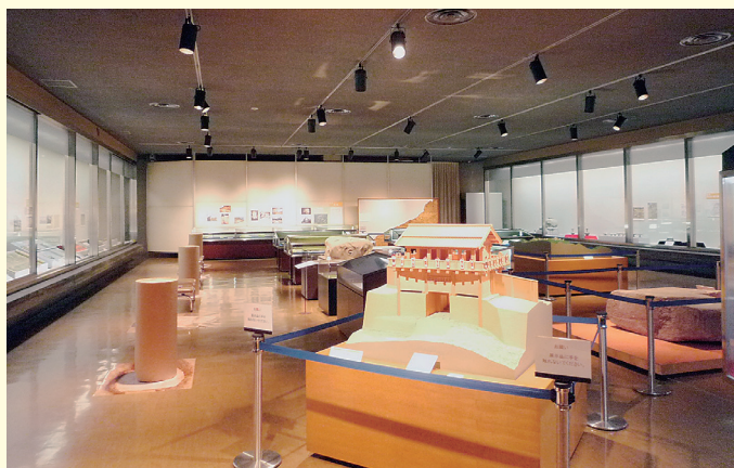
<特別展より>展示風景