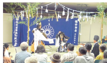
備中神楽「吉備津能」

ふだんは滅多に見られない温羅伝説を演じる備中神楽「吉備津能」の公演には80名が観覧されました。