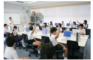
備前焼コースの新聞作り

文化財見学、博物館での館内授業、そして学校でのまとめという3日間の日程で岡山の歴史と文化を学ぶ吉備の国ジュニア歴史スクール。上半期に文化財見学と館内授業を実施した浅口市立金光吉備小学校と、久米南町立弓削・誕生寺・神目小学校、桃太郎コースの矢掛町立美川・三谷・山田・中川小学校の子どもたちは、特別展「鬼ノ城展」の開催時期に合わせて博物館を訪れ、館内授業を行いました。3日目は、2日間の成果をもとに各校とも工夫を凝らしたまとめを行いました。パソコンを利用して作成した新聞や紙芝居や劇によるまとめ、発表会等、いずれも素晴らしいものでした。今年度の様子を報告集にまとめ県内のすべての小学校へ配布しています。