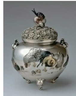
群鶏図香炉 正阿弥勝義作 清水三年坂美術館蔵