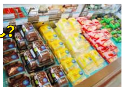
モンテール (総社市) 2014年操業

みんなが知っているあの商品も岡山で作っているよ。 「岡山産」って、うれしいよね。