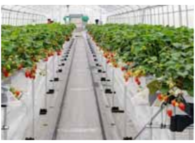
ヤママー (倉敷市) 2016年操業