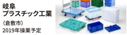
岐阜プラスチック工業 (倉敷市) 2019年操業予定